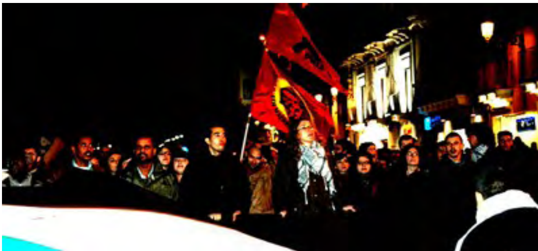
Sicilia, gennaio 2009