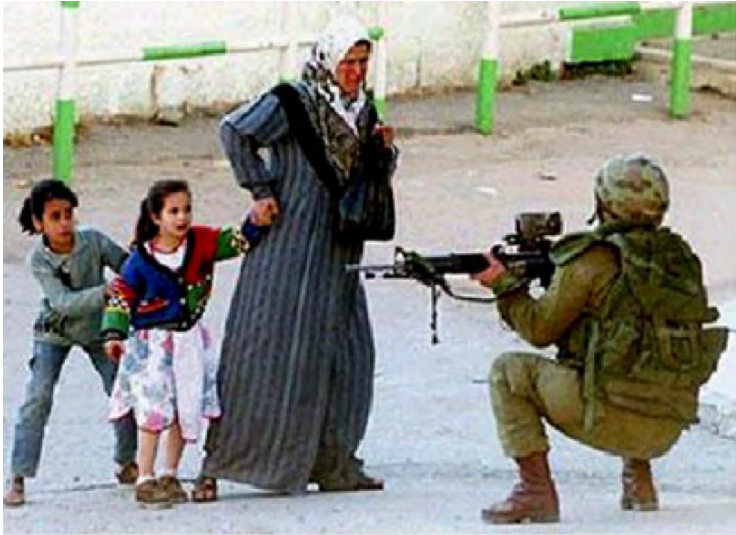
Palestina, gennaio 2009